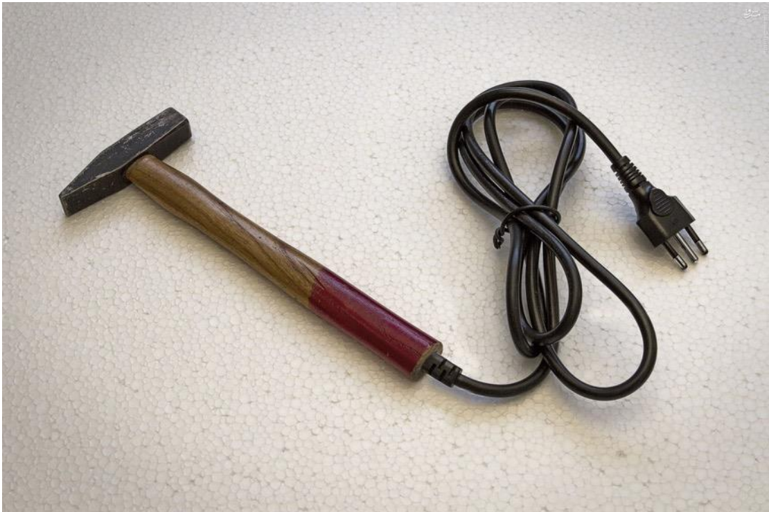
«Απίστευτο, αλλά όχι αδύνατο», Giuseppe Colarusso / Σειρά ψηφιακά επεξεργασμένων φωτογραφιών