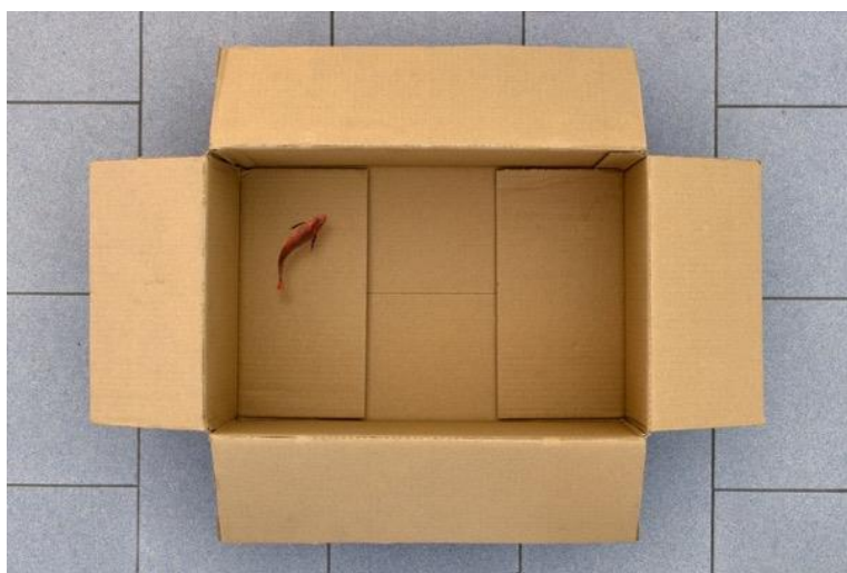
«Απίστευτο, αλλά όχι αδύνατο», Giuseppe Colarusso / Σειρά ψηφιακά επεξεργασμένων φωτογραφιών

1. Παρατήρησε καλά το πιο πάνω έργο. Ποιο μήνυμα νομίζεις ότι θέλει να μεταδώσει ο καλλιτέχνης;