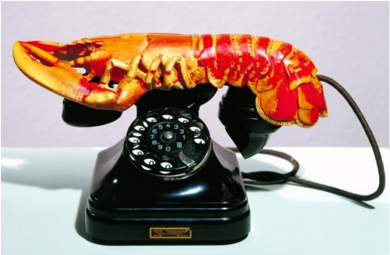
«Τηλέφωνο Αστακός», Salvador Dali / Φωτογραφία

Και μην ξεχνάς: Όλες οι απαντήσεις είναι σωστές!!!!