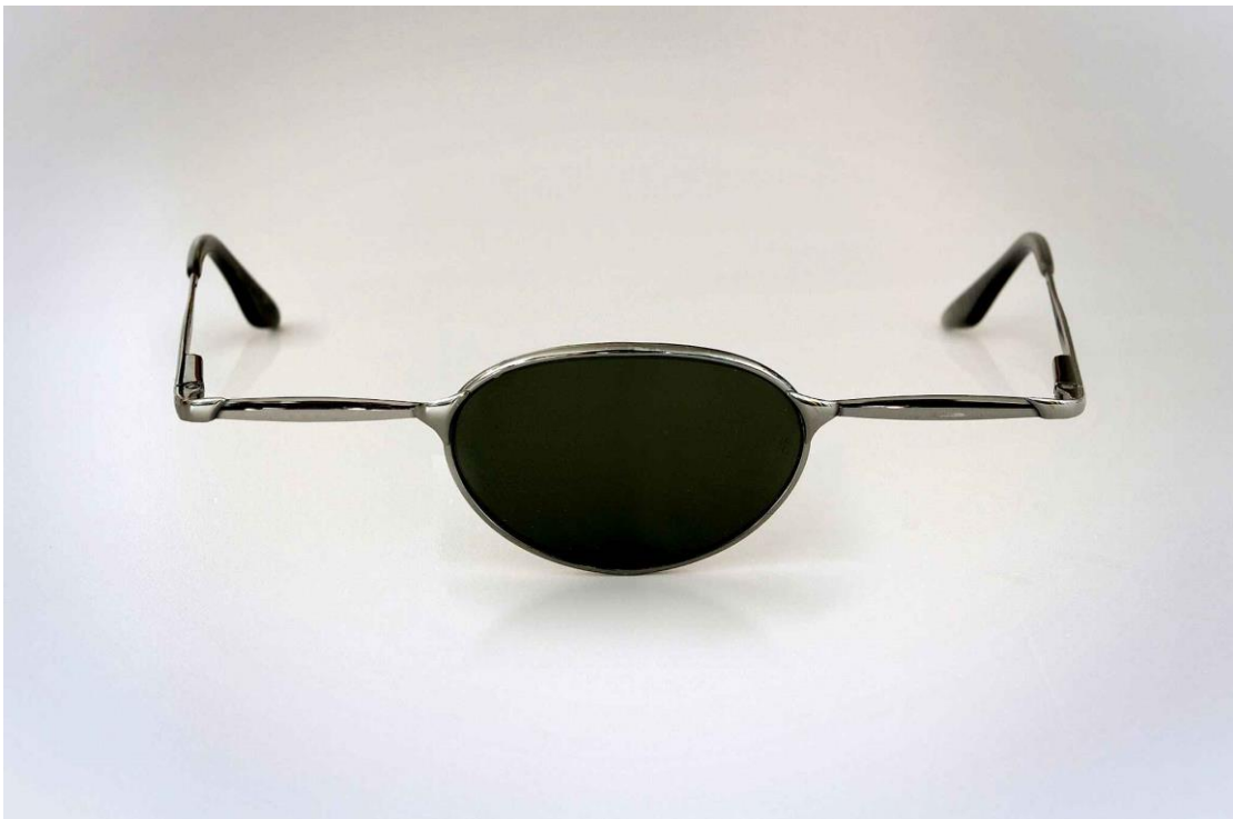
«Απίστευτο, αλλά όχι αδύνατο», Giuseppe Colarusso / Σειρά ψηφιακά επεξεργασμένων φωτογραφιών