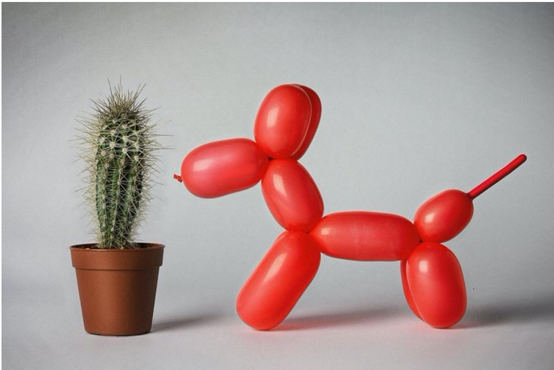
«Απίστευτο, αλλά όχι αδύνατο», Giuseppe Colarusso / Σειρά ψηφιακά επεξεργασμένων φωτογραφιών