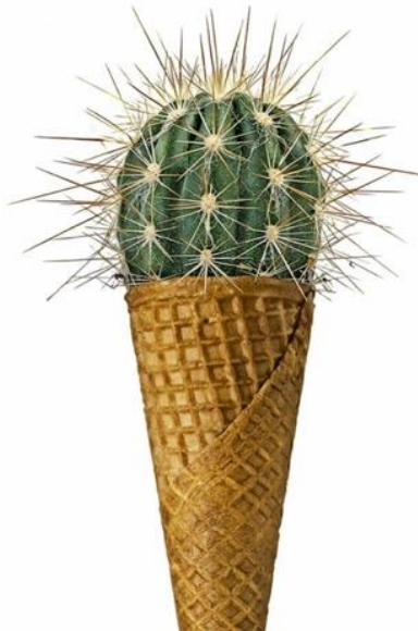
«Απίστευτο, αλλά όχι αδύνατο», Giuseppe Colarusso / Σειρά ψηφιακά επεξεργασμένων φωτογραφιών