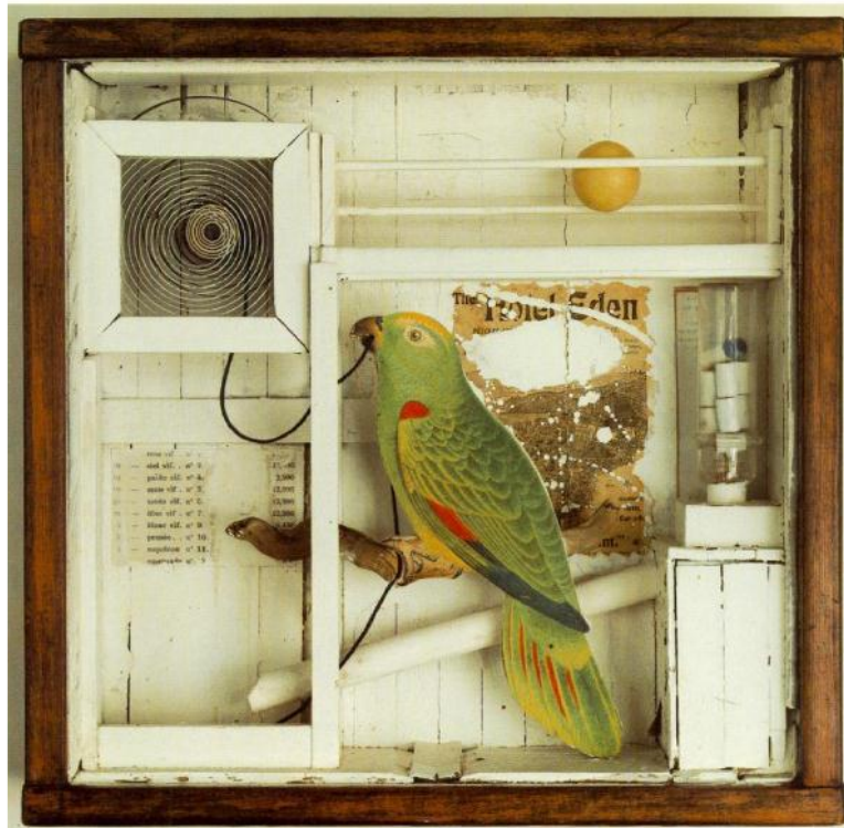
Το ξενοδοχείο Εδέμ, Τζόζεφ Κορνέλ