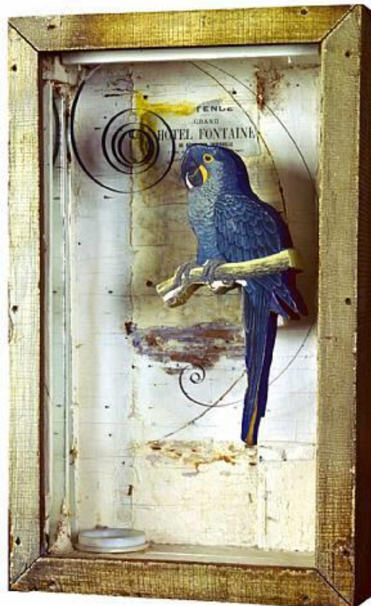
Οι άγγελοι του Kivi, Τζόζεφ Κορνέλ